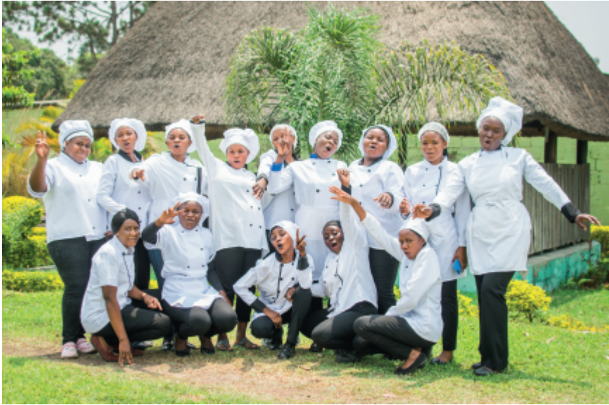
Schülerinnen Kochkurs an der Berufsschule in Ndola Sambia

Tag Kindern und Jugendlichen ein Stück Hoffnung und Lebensmut mit auf den Lebensweg geben.