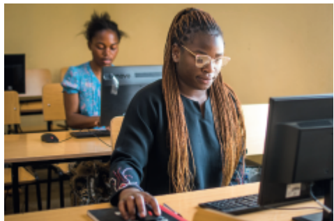
Computerkurs am Walani Frauenprojekt in Malawi

Wir danken für alle, die an der Herrnhuter Academy auf Sansibar arbeiten und die im Kindergarten, in den Schulen und in der Berufsausbildung jeden