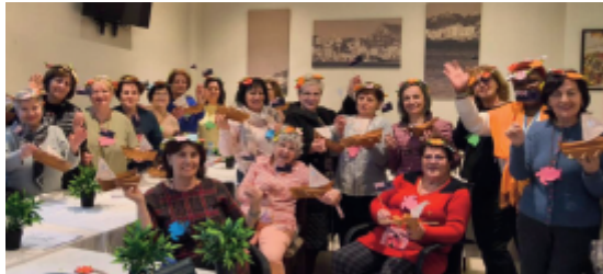
Frauen in Albanien zum Weltgebetstag

Wir danken für die Arbeit in Albanien, die vielen Menschen Mut macht und ein christliches Zeichen setzt. Wir danken für die gelungene Begegnung zwischen Frauen aus Albanien und Deutschland in Bad Boll.