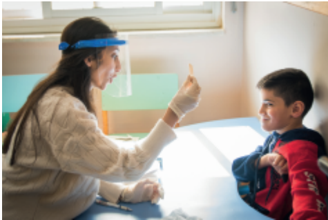
Sprachtherapie auf dem Sternberg

Wir danken für die Arbeit der Mitarbeiterinnen im Starmountain Rehabilitation Center (Sternberg) in Palästina, die schon seit einem Jahr in gefährlicher, völliger Unsicherheit leben müssen und die trotzdem jeden Tag den Kindern und Jugendlichen mit Behinderungen einen geregelten Alltag, Schutz und Vertrauen geben.